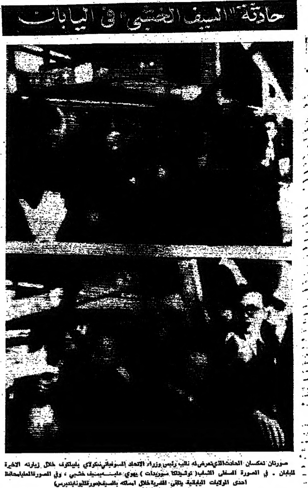
صورتان لشبان الحائضتين عرضا له نائب رئيس وزراء الاتحاد السوفياتي نيكولاي بابلوكوف خلال زيارته الاخيرة للبلدان . في الصورة السفلى الشاب (توشينكا سوريات) يروي عليه صليب خشبي ، وفي الصورة العليا يلعبان احدى الولايات الرياضية يتلقى للضربة خلال املاكه بالسيف (سوريات سوريات).

وقال في خطاب القاها في بادية عشاء هنا ان توري المدون الامبريالي والاستعمار اطلقت ستان حرب جويته في فيتنام ولجات الى التخل في لاوس وارتكبت عدوانا على البلدان العربية الحية للسلام في الشرق الاوسط وتحاول توريط شعوب مناطق كثيرة في العالم بينها الهند في نيدلبي . وقال المستر كوسيفين في اجتماع خاص عقده الجمعية الثقافية الهندية - السوفياتية